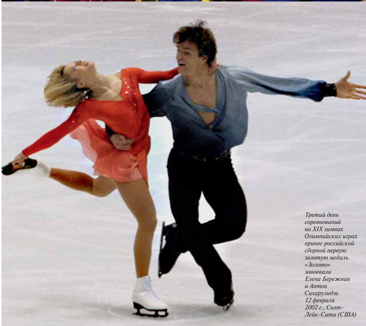
Третий день соревнований на XIX зимних Олимпийских играх принес российской сборной первую золотую медаль. «Золото» завоевали Елена Бережная и Антон Сихарулидзе. 12 февраля 2002 г., Солт-Лейк-Сити (США)