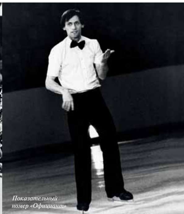
Показательный номер «Официант»

Я не верю в формулы. Даже если бы она у меня была, вряд ли кому-то пригодилась. Любовь — это очень индивидуально, советы здесь бесполезны.