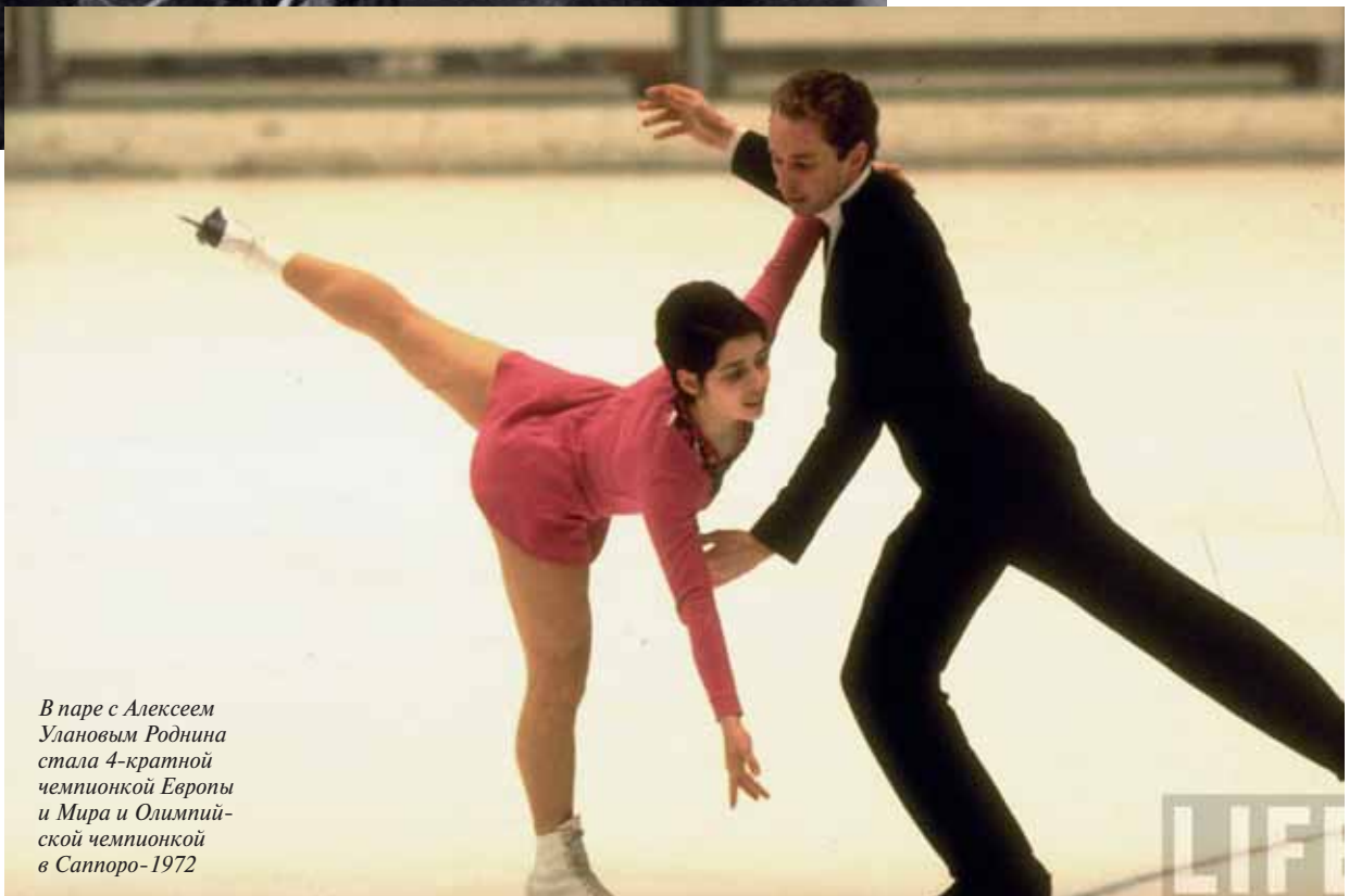
В паре с Алексеем Улановым Роднина стала 4-кратной чемпионкой Европы и Мира и Олимпийской чемпионкой в Саппоро-1972

«МОЙ ВТОРОЙ МУЖ ВСЕ РАССКАЗЫВАЛ, ЧТО ЕМУ ОЧЕНЬ ПРАВИТСЯ ЖЕНА, НО ЕСТЬ МАЛЕНЬКОЕ „НО“: СЛИШКОМ ИЗВЕСТНАЯ»