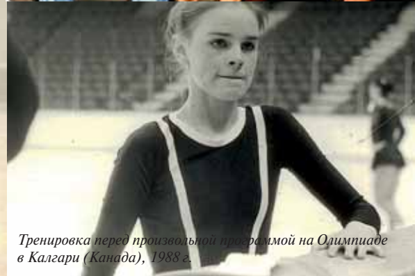
Тренировка перед произвольной программой на Олимпиаде в Калгари (Канада), 1988 г.

мечтах и разочарованиях». Было много разговоров о том, зачем Катя написала книгу «Мой Сергей». А как вы думаете, нужна была все-таки эта книга или нет?