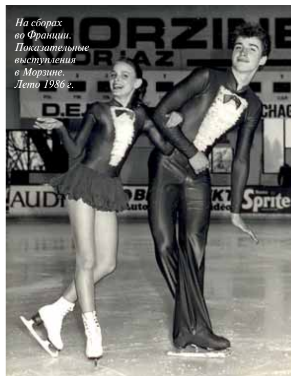
На сборах во Франции. Показательные выступления в Морзине. Лето 1986 г.