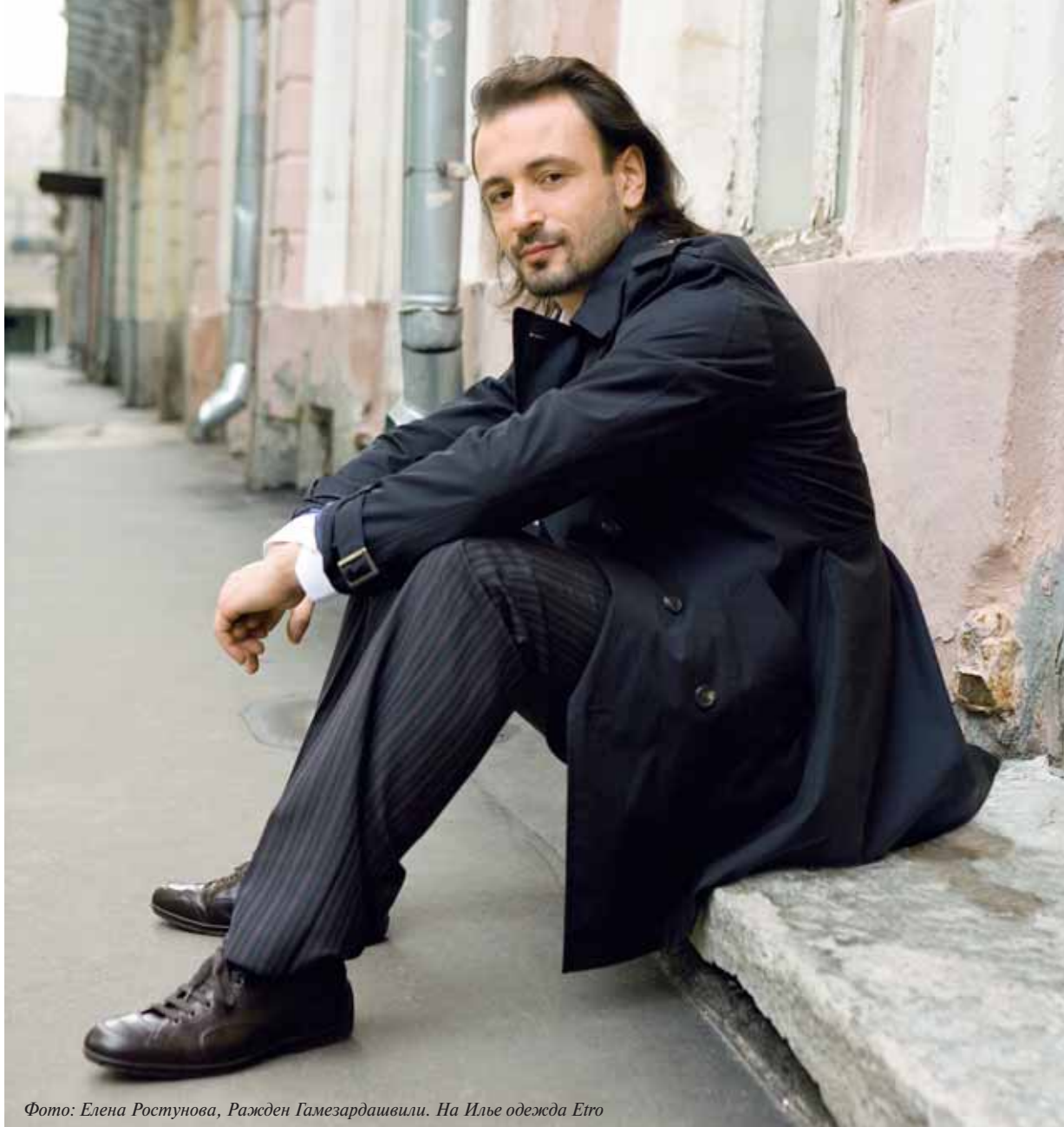
Фото: Елена Ростунова, Ражден Гамезардашвили. На Илье одежда Etro

Здесь немного другая история. Они не умеют кататься на коньках, публично заявили об этом и о том, что учатся это делать. Ведь наши политики от спорта не говорят, что они ничего не понимают в политике: мол, дайте нам 4 года, мы посидим в Думе и чему-нибудь научимся. Не хочу бить кулаком в грудь и говорить, что я чистый как кристалл, — просто высказываю свою точку зрения. Думаю, жизнь всегда показывает, что лишнее, и оно всегда отпадает.