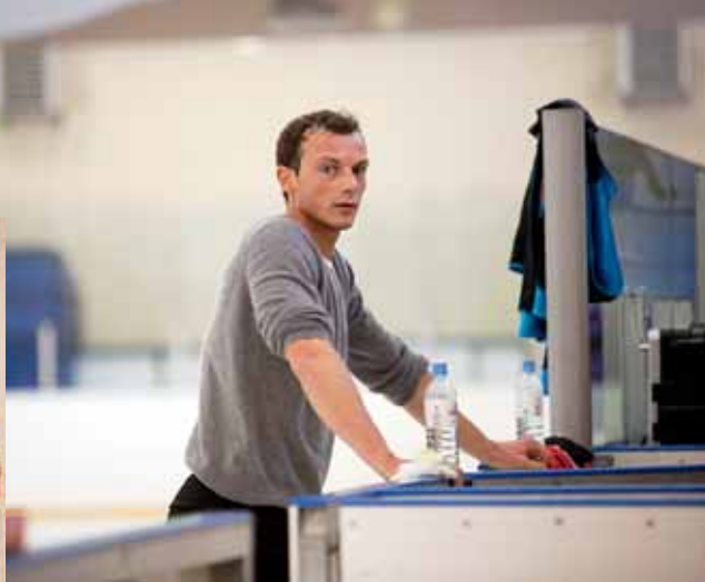
Наша первоочередная задача — подготовить программы и достойно выступить на предвступительных соревнованиях перед чемпионатом России