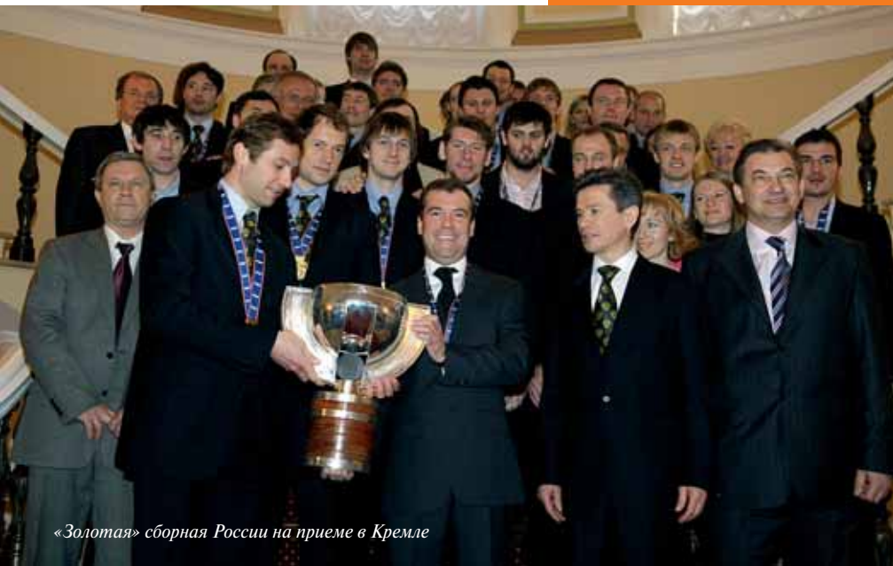
«Золотая» сборная России на приеме в Кремле

Такое происходит не только на нашем поприще, но и в любых сферах деятельности человека. Это человеческие взаимоотношения, через которые проявляется отношение к успеху и неудаче, возникает чувство сопричастности или негодования, злобы и зависти. Все это черты и недостатки нашего общества. Мы забываем хорошее, злимся при неудаче, начинаем свистеть, когда что-то не получается, давая соперникам преимущество в тот момент, когда, наоборот, надо поддерживать своих. Когда я пришел в эту профессию, то понимал, что наш мир не идеален и подобных ситуаций не избежать. Выиграть все невозможно, и ты рано или поздно будешь наталкиваться на такие моменты, когда тебя будут хотеть растерзать, причинить боль. Я не думаю, что есть люди, которые в своей жизни