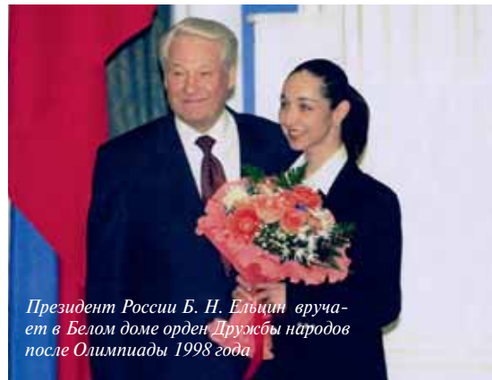
Президент России Б. Н. Ельцин вручает в Белом доме орден Дружбы народов после Олимпиады 1998 года