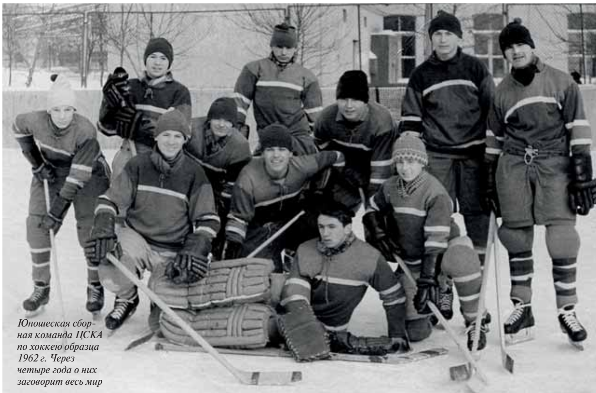
Юношеская сборная команда ЦСКА по хоккею образца 1962 г. Через четыре года о них заговорит весь мир