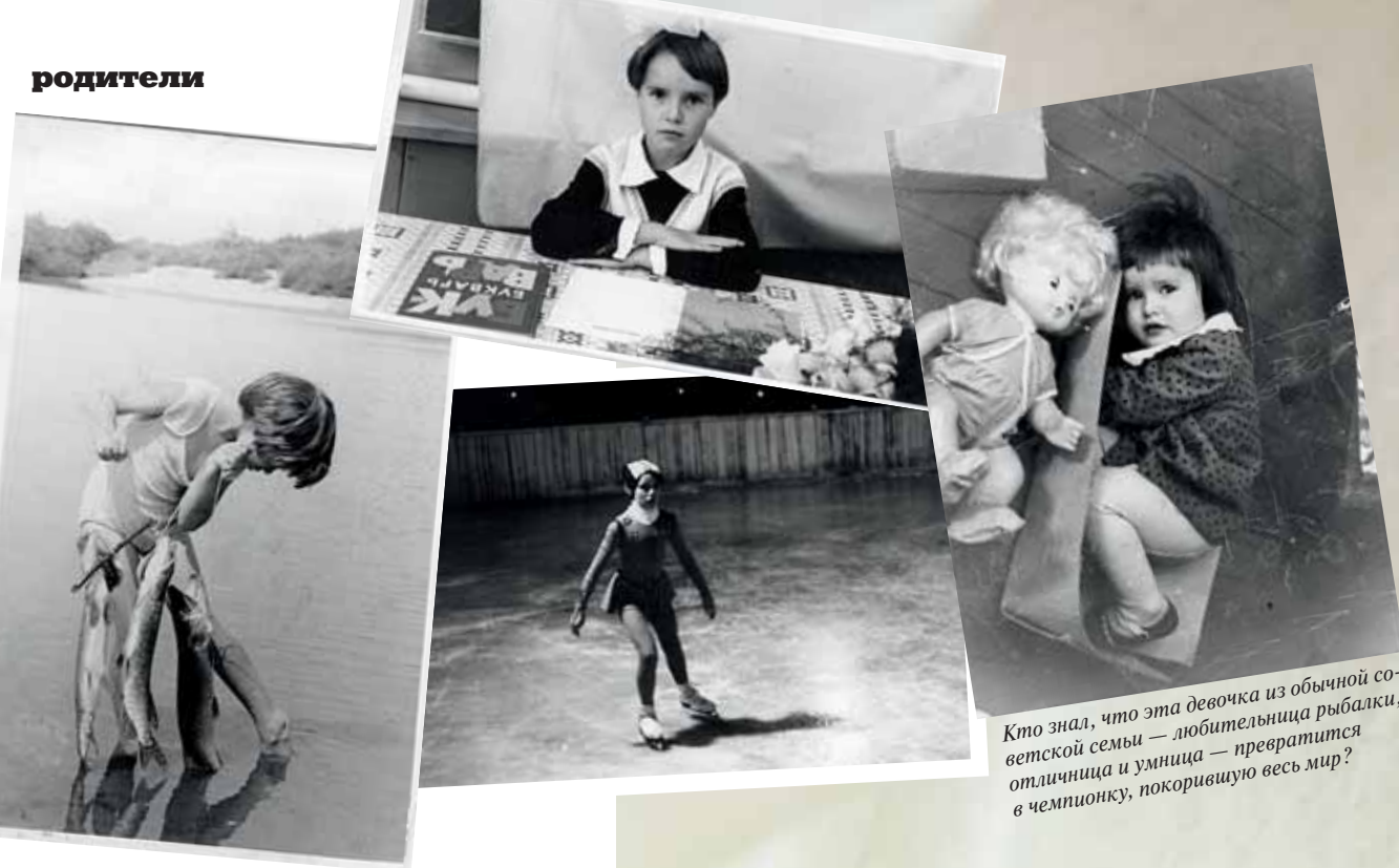
Кто знал, что эта девочка из обычной советской семьи — любительница рыбалки, отличница и умница — превратится в чемпионку, покорившую весь мир?