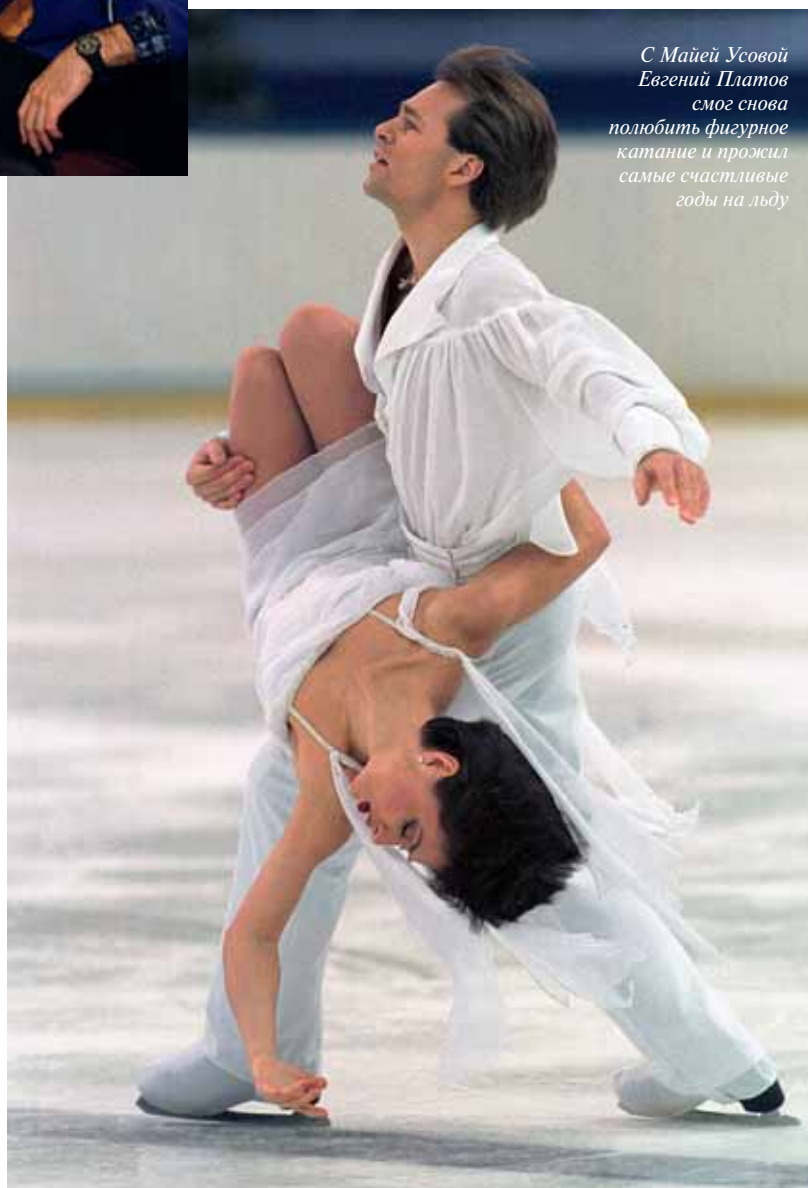
С Майей Усовой Евгений Платов смог снова полюбить фигурное катание и прожил самые счастливые годы на льду

стоянно была в слезах и в истерике. Сейчас это воспринимается как карикатура, комедия, но тогда нам так не казалось. Я ходил буквально зеленого цвета. Думал, что либо сойду с ума, либо с ней что-нибудь сделаю. Помню, я вызвал в Америку своих родителей — больше не мог в этом ужасе находиться, у меня тоже могла съехать крыша. Отец сказал: «Побеждает тот, кто умеет ждать. Научись терпеть, и твое время придет». И я терпел. Но когда мы выиграли вторую Олимпиаду, то сразу расстались.