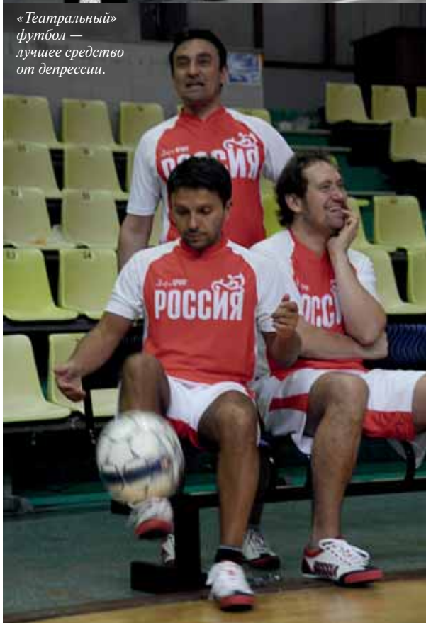
«Театральный» футбол — лучшее средство от депрессии.