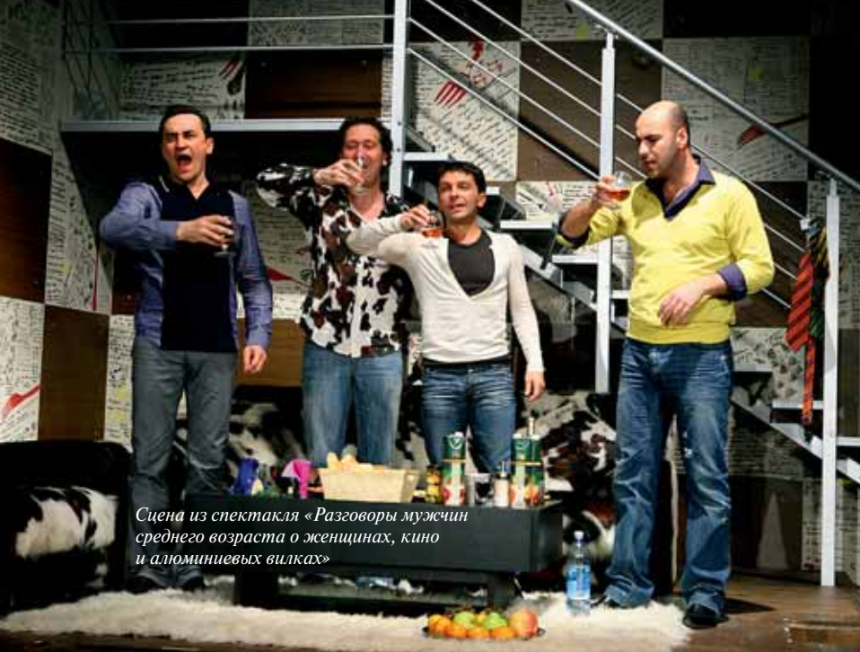
Сцена из спектакля «Разговоры мужчин среднего возраста о женщинах, кино и алюминиевых вилках»

«Несмотря на все разборки, ощущение того, что лучше держаться друг друга, побеждает»