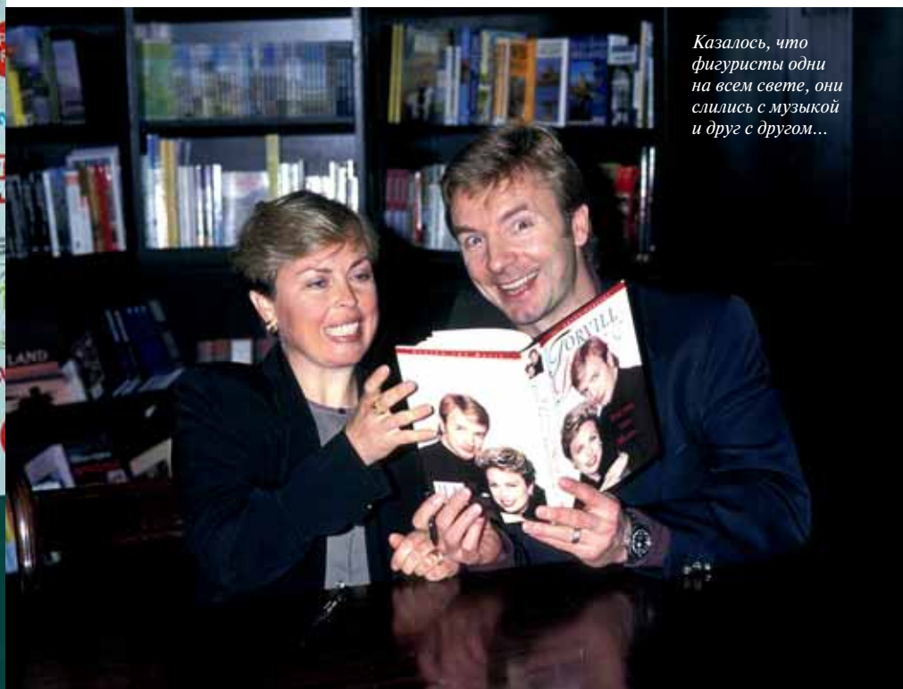
Казалось, что фигуристы одни на всем свете, они слились с музыкой и друг с другом...