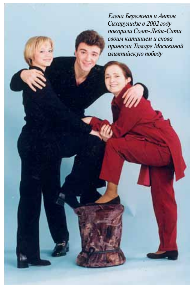
Елена Бережная и Антон Сихарулидзе в 2002 году покорили Солт-Лейк-Сити своим катанием и снова принесли Тамаре Москвиной олимпийскую победу