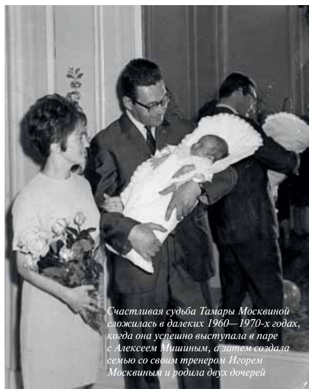
Счастливая судьба Тамары Москвиной сложилась в далеких 1960—1970-х годах, когда она успешно выступала в паре с Алексеем Мишиным, а затем создала семью со своим тренером Игорем Москвиным и родила двух дочерей