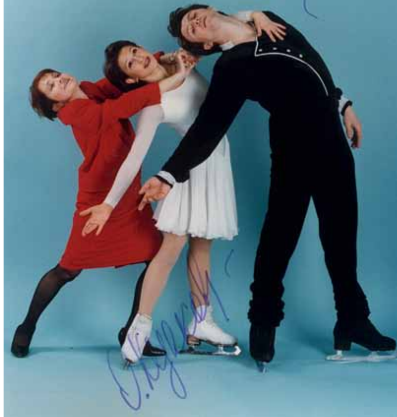
Артур Дмитриев — уникальный фигурист, дважды становившийся олимпийским чемпионом с разными партнерами. В 1998 году в Нагано он с Оксаной Козаковой продолжил эстафету олимпийских побед учеников Тамары Москвиной