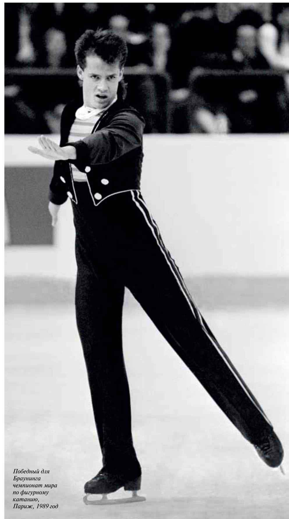
Победный для Браунинга чемпионат мира по фигурному катанию, Париж, 1989 год