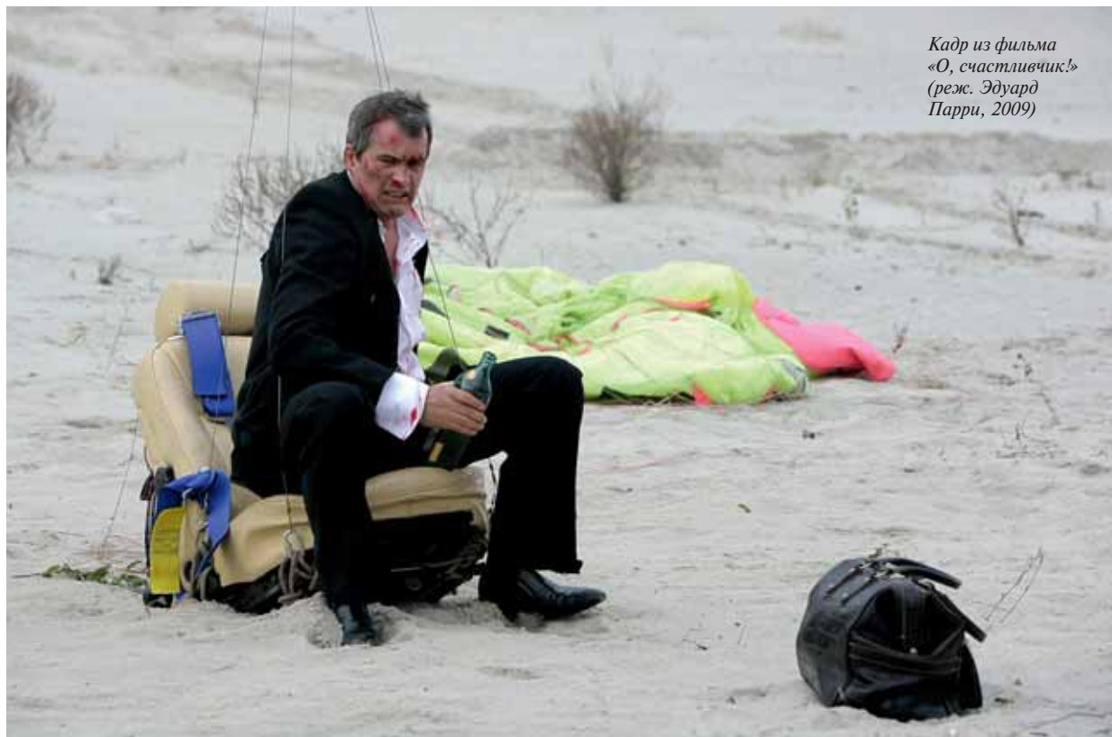
Кадр из фильма «О, счастливец!» (реж. Эдуард Парри, 2009)