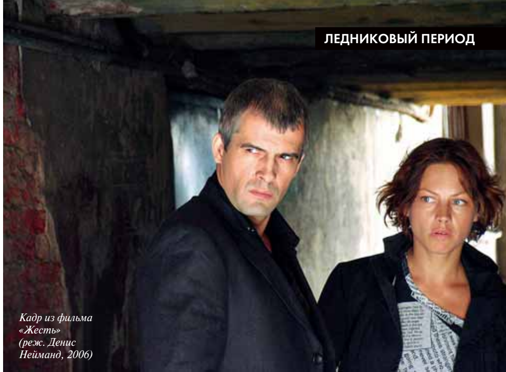
Кадр из фильма «Жесть» (реж. Денис Нейманд, 2006)

В воротах я играл на специальных вратарских коньках — они меня еще как-то держали. И играл, кстати, неплохо. Иногда, конечно, случались и травмы, но меня это не сильно расстраивало. Помню, однажды — когда уже работал на