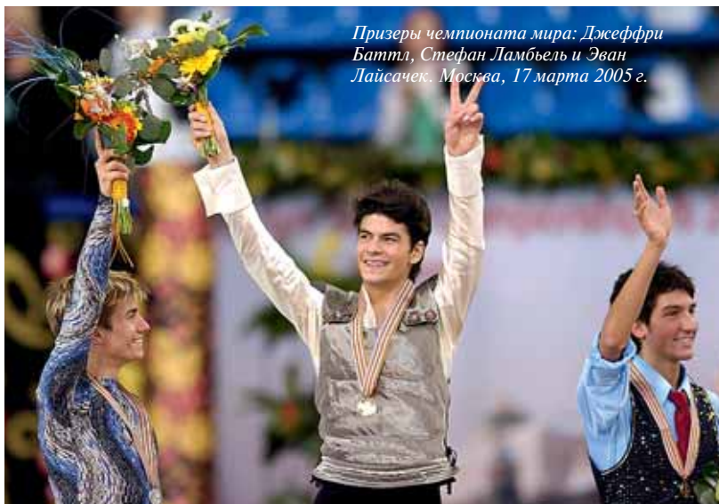
Призеры чемпионата мира: Джеффри Баттл, Стефан Ламббель и Эван Лайсачек. Москва, 17 марта 2005 г.