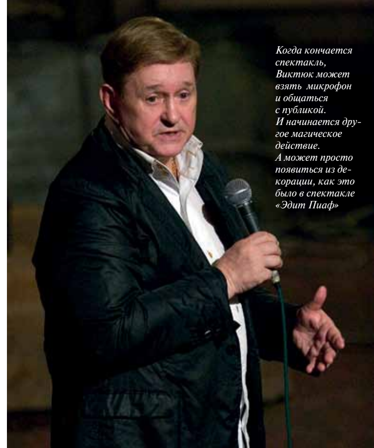
Когда кончается спектакль, Виктюк может взять микрофон и общаться с публикой. И начинается другое магическое действие. А может просто появиться из декорации, как это было в спектакле «Эдит Пиаф»

Абсолютно ничего! А я же еще и издевался над ними! При чем совершенно открыто. Вводил в спектакли тексты Солженицына, Синявского, Гумилева — так было и в Ленинграде в Театре комедии, и во МХАТе, где тоже довелось работать в советское время. Черт-те что творил! В спектакле по пьесе Ивана Франко «Украденное счастье» нам запретили показывать греко-католическую службу. Но в итоге там все-таки прозвучала эта служба — от начала до конца, ровно полтора часа. Кстати, фонограмму с записью этой службы мне специально прислали к нашему спектаклю из Канады. Вообще среди чиновников от искусства, от которых все зависело, находились и умные люди, которые