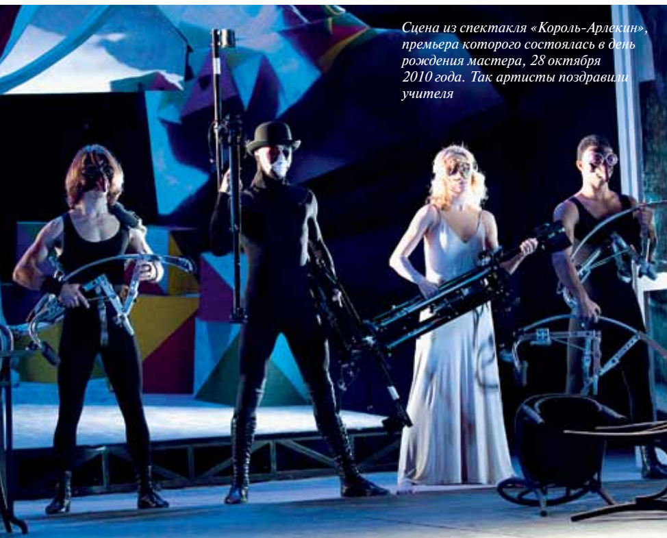
Сцена из спектакля «Король-Арлекин», премьера которого состоялась в день рождения мастера, 28 октября 2010 года. Так артисты поздравили учителя

Да нет. Когда я впервые приехал в Москву из Львова, мне было семнадцать лет. Помню, как ехал в общежитие на троллейбусе № 2 с Киевского вокзала и увидел Кремль. Это было потрясение! Эти елки, этот свет — стоял фантастический вечерний закат! И вдруг вижу первый угловой дом у Кремля. Украинский ребенок во мне говорит: «Отвернись! Ты там никогда не сможешь жить. Забудь об этом!» Я посмотрел одним глазом — и все, больше никогда не смотрел. Уже ставил спектакли во МХАТе, но всегда этот дом обходил. А когда узнал спустя много лет, что мне дают квартиру здесь, не поверил. И до сих пор не верю: выхожу из лифта, смотрю в почтовый ящик и всегда боюсь, что там лежит бумажка, в которой написано, что эта квартира уже не моя.