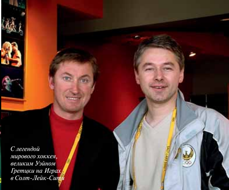
С легендой мирового хоккея, великим Уэйном Гретцки на Играх в Солт-Лейк-Сити

свою максимальную цену и лег спать. В пять утра позвонил Ульф и сказал, что я проиграл. Учитывая, что у меня была и остается самая крупная в мире частная коллекция олимпийских знаков начиная с первых Игр 1896 года, я был и удивлен, и озабочен: кто же посягнул на мое царствование?