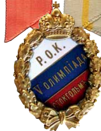
Первый российский знак на Олимпиадах. Также очень редкий экспонат