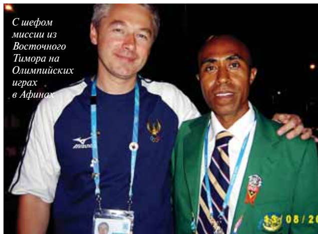
С шефом миссии из Восточного Тимора на Олимпийских играх в Афинах