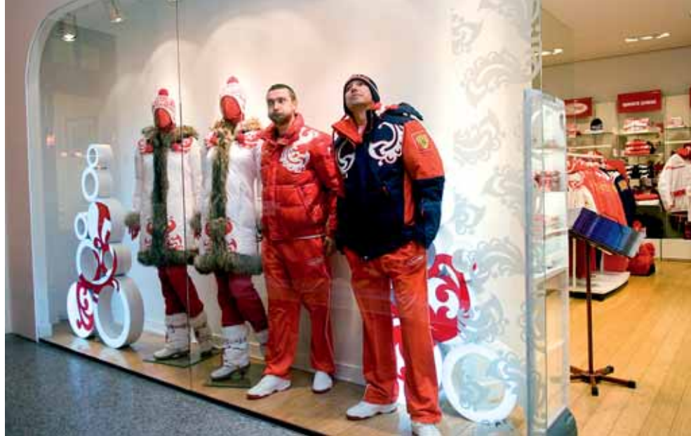
Перед отъездом в Ванкувер братья Кристовские заехали в магазин «BoscoSPORT» за комплектом олимпийской формы. Примерка превратилась в настоящее шоу