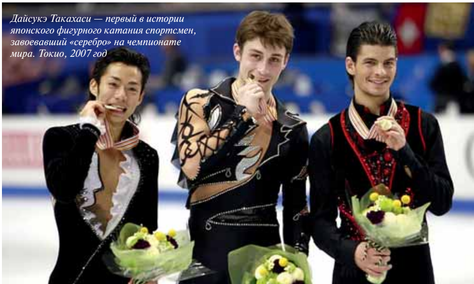
Дайсукэ Такахаси — первый в истории японского фигурного катания спортсмен, завоевавший «серебро» на чемпионате мира. Токио, 2007 год

Одна — золотая — у Шизуки Аракавы, вторая — бронзовая — у Грушиной и Гончарова. Потом я работал четыре года с японскими спортсменами, в числе которых был Дайсукэ Такахаси — один из немногих, кто готов был бороться за «золото» на Олимпиаде в Ванкувере. Но за год до Олимпиады у меня возникла с ним проблема: он подписал контракт, и совершенно некомпетентные люди стали вмешиваться в тренировочный процесс. Другой бы сдержался и продолжал тренировать его, потому что спортсменами такого уровня не бросаются. Я же не побоялся сказать ему «до свидания». Кстати, во время недавнего этапа Гран-при в Японии произошел показательный случай. В Японию я привез француза Флорана Амодио. Правда, он занял там только третье место, зато, когда я вышел на улицу после соревнований, толпа японских болельщиков мне хлопала и поздравляла. Они в курсе ситуации с Дайсукэ и понимают, что я опять — за год — умудрился на порядок поднять уровень спортсмена — в отличие от Такахаси, который за этот год ничего не прибавил, а только уходит вниз.