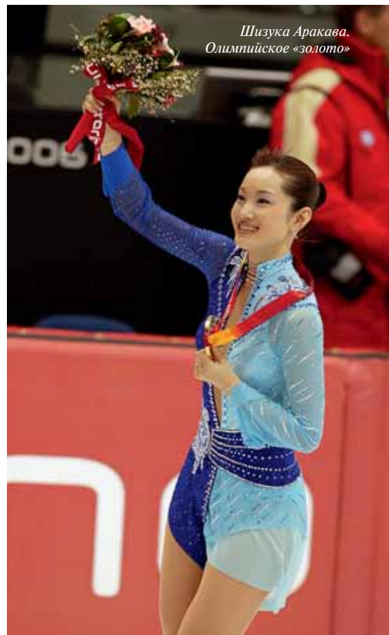
Шизука Аракава. Олимпийское «золото»

Мне недостаточно просто жить — спокойно, размеренно, стабильно