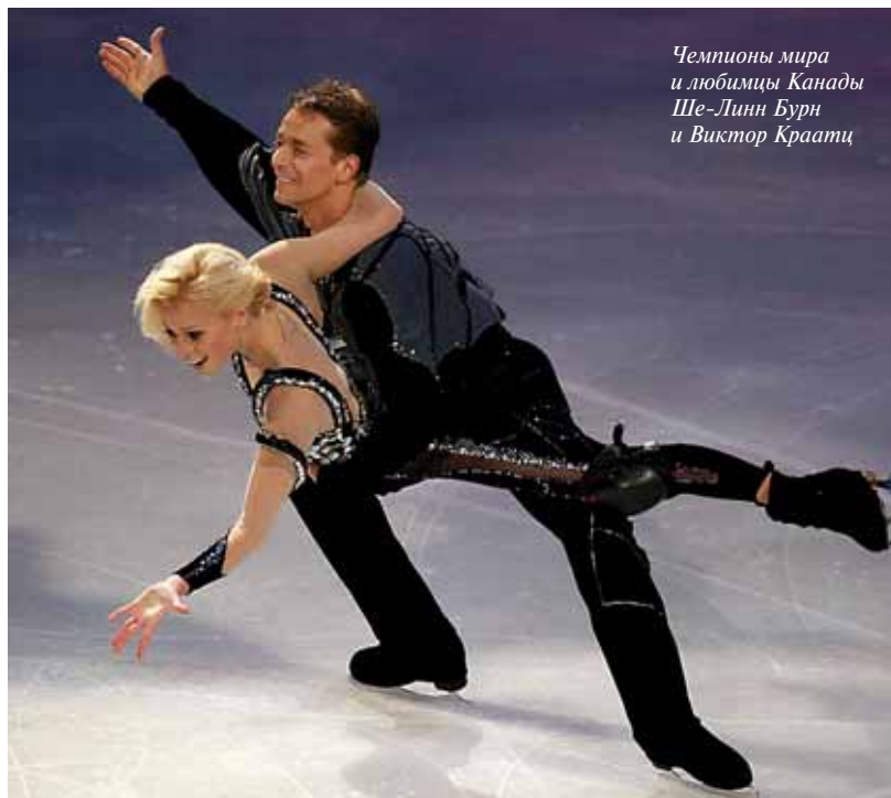
Чемпионы мира и любимцы Канады Ше-Линн Бурн и Виктор Краац