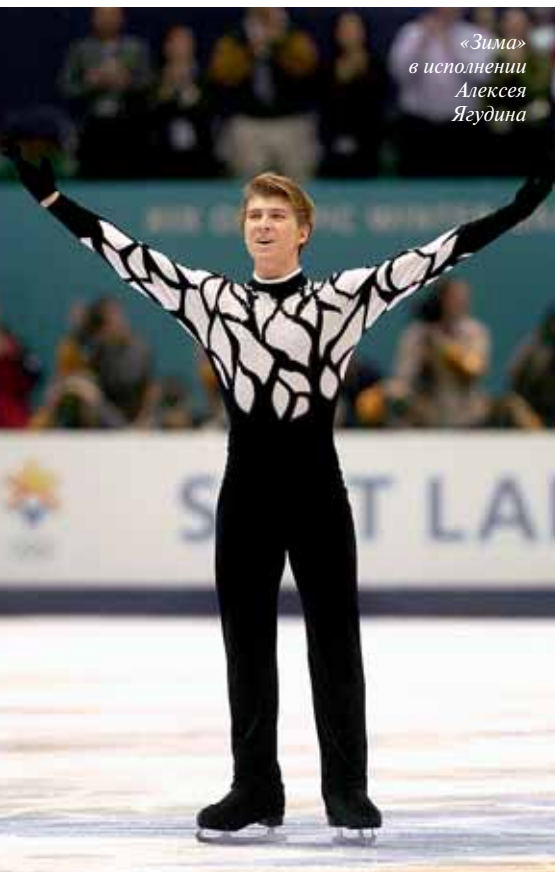
«Зима» в исполнении Алексея Ягудина

Поправьте меня, если я не права, но мне кажется, что за всю историю фигурного катания того больше не было, чтобы человек, только три года назад завершивший свою спортивную карьеру, делает постановку, которая вот уже почти десять лет заставляет зрителей аплодировать стоя.