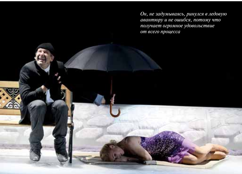
Он, не задумываясь, ринулся в ледовую авантюру и не ошибся, потому что получает огромное удовольствие от всего процесса